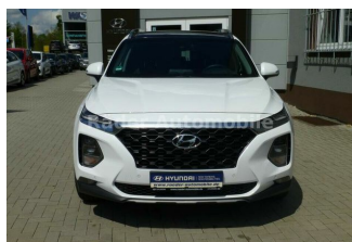
09621-91708917 - Hyundai i best Gütesiegel