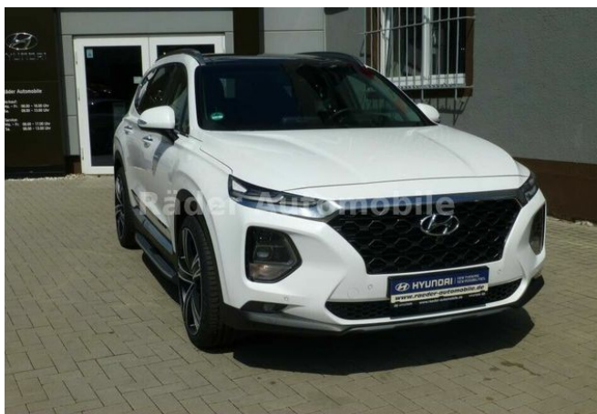
09621-91708917 - Hyundai i best Gütesiegel