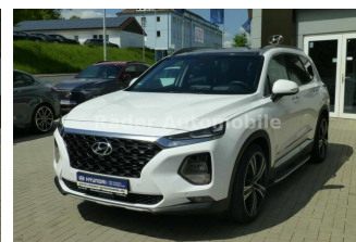
09621-91708917 - Hyundai i best Gütesiegel