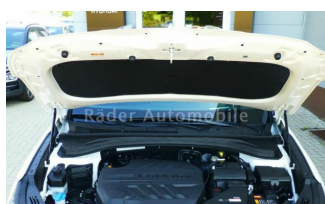
09621-91708917 - Hyundai i best Gütesiegel