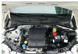
09621-91708917 - Hyundai i best Gütesiegel