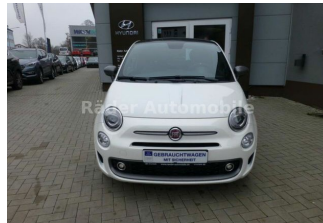
09621-91708917 - Hyundai i best Gütesiegel