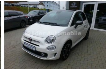
09621-91708917 - Hyundai i best Gütesiegel