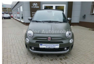
09621-91708917 - Hyundai i best Gütesiegel