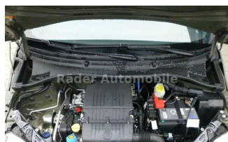
09621-91708917 - Hyundai i best Gütesiegel