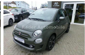
09621-91708917 - Hyundai i best Gütesiegel