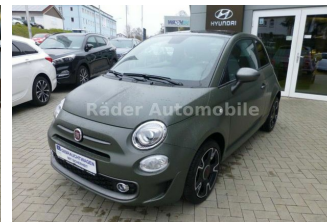
09621-91708917 - Hyundai i best Gütesiegel