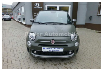
09621-91708917 - Hyundai i best Gütesiegel