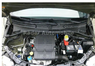
09621-91708917 - Hyundai i best Gütesiegel