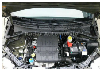
09621-91708917 - Hyundai i best Gütesiegel