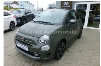
09621-91708917 - Hyundai i best Gütesiegel