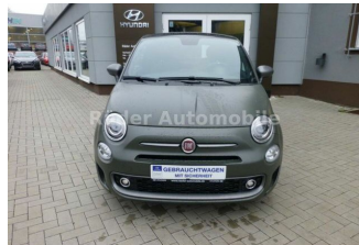
09621-91708917 - Hyundai i best Gütesiegel