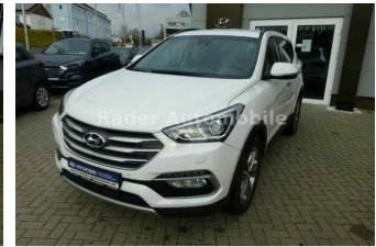
09621-91708917 - Hyundai i best Gütesiegel