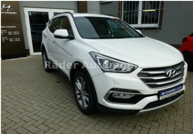
09621-91708917 - Hyundai i best Gütesiegel