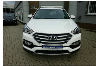
09621-91708917 - Hyundai i best Gütesiegel