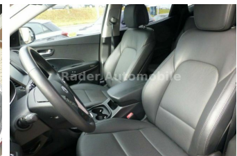
09621-91708917 - Hyundai i best Gütesiegel